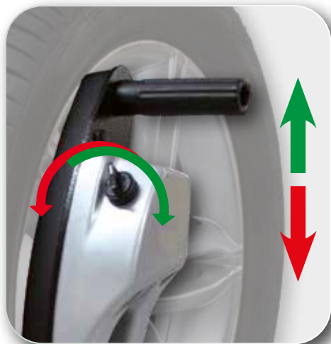
AUTOMATIQUE - AUTOMATISCH